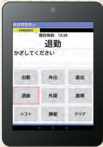
タブレットのNFC機能より、ICカードによる打刻。