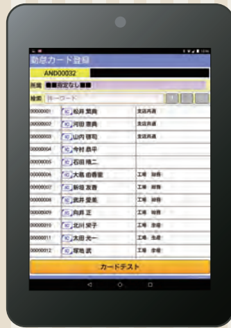
勤怠カード登録画面

就業大臣に登録されている社員名が表示されます。写真とICカードの紐付け登録をタブレットのみで可能です。※就業大臣の社員マスター取り込み作業は不要です。